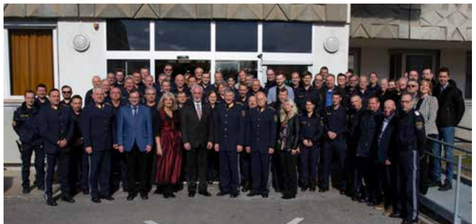
Die SVP der LPD Steiermark mit den Ehrengästen nach der Dekretübergabe