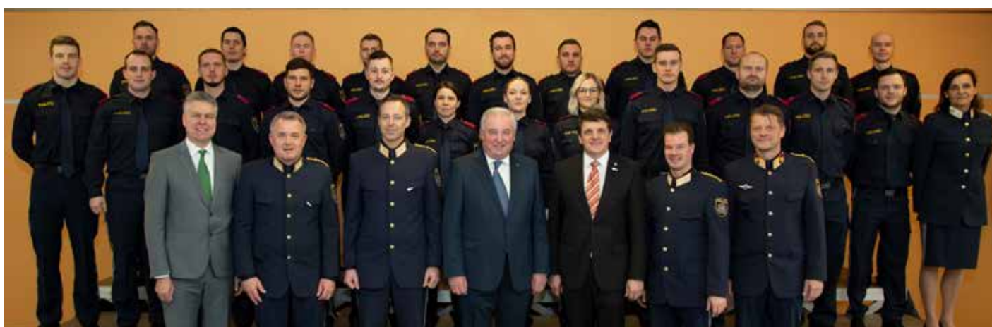
Der GAL G-PGA 15-18-F-St