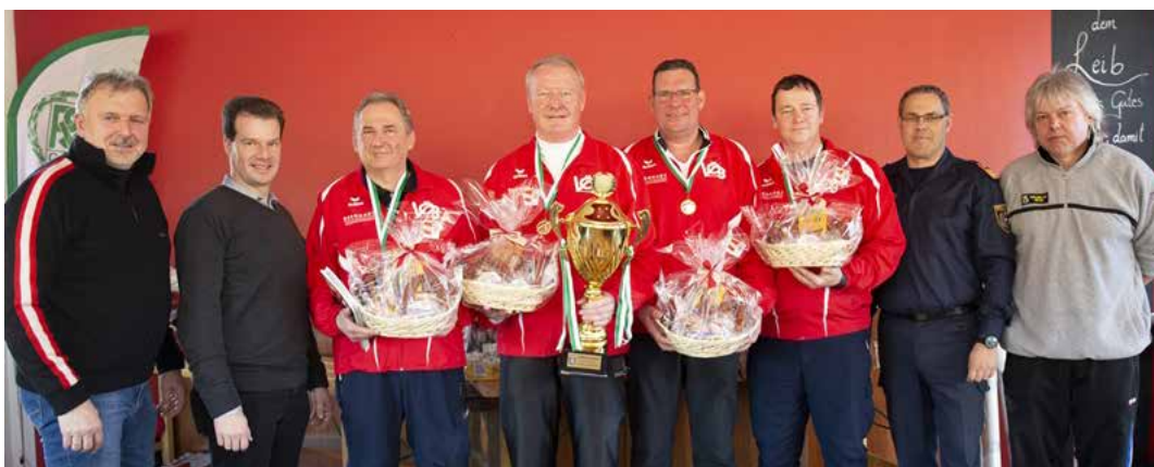
Sieger der Gruppe A und somit Landesmeister 2020 - Exekutiv-Team