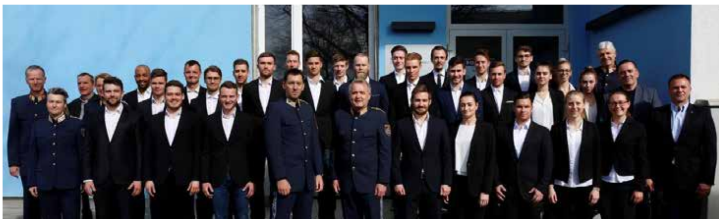
Der GAL G-PGA05-20-G-St mit Ehren- und Festgästen nach der Angelobung

Das Team der FSG Steiermark gratuliert allen zur Aufnahme in die Polizei und wünscht euch und eurem Kurskommandanten sowie deren Stellvertretern alles Gute für die Ausbildung im Bildungszentrum für die Sicherheitsexekutive.