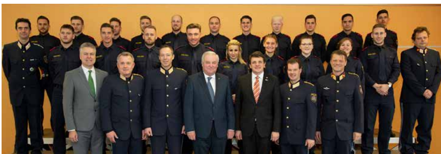
Der GAL St-PGA 04-18-F-St