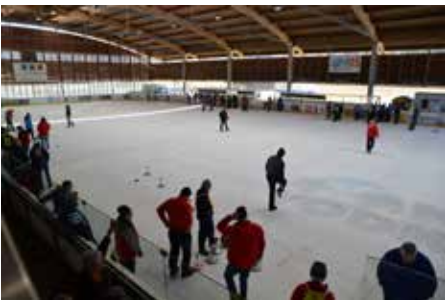
18 Teams nahmen an den LM 2020 in der Eis- und Mehrzweckhalle in Frohnleiten teil

Nachdem 2019 die Exekutiv-Landesmeisterschaft im Freizeitpark Frohnleiten auf Asphalt stattfand, wurde die Landesmeisterschaft 2020 am 30. Jänner 2020 von der Polzeisportvereinigung Graz/Sektion Eis- und Stocksport auf Eis durchgeführt. Teilnahmeberechtigt waren Exekutiv-, Justiz- und Zollbeamte des Aktiv- und Ruhestandes und Bedienstete des Bundesamtes für Fremdenwesen und Asyl.