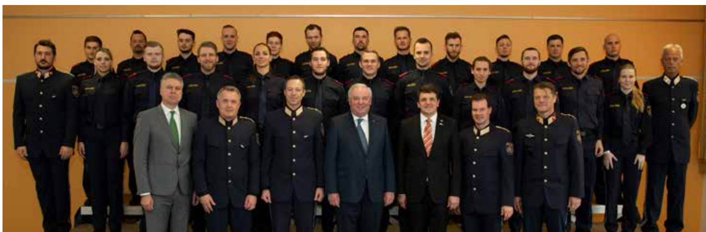
Der GAL G-PGA 14-18-E-St