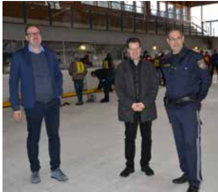
Ehrengäste verfolgen gemeinsam das Geschehen am Eis

Die 18 Teams wurden nach dem Ergebnis der Landesmeisterschaft 2019 in 2 Vorrundengruppen (BLAU und ROT) gelost. Im Anschluss an die Vorrunde wurden die Finalspiele ausgetragen, wobei sich der 1. und 2. jeder Gruppe für das A-Finale bzw. das Spiel um den 3. Platz der Gruppe A qualifizierte. Der 3. und 4. jeder Gruppe qualifizierte sich für das B-Finale bzw. das Spiel um den 3. Platz der Gruppe B. Es wurden alle Platzierungen ausgespielt.