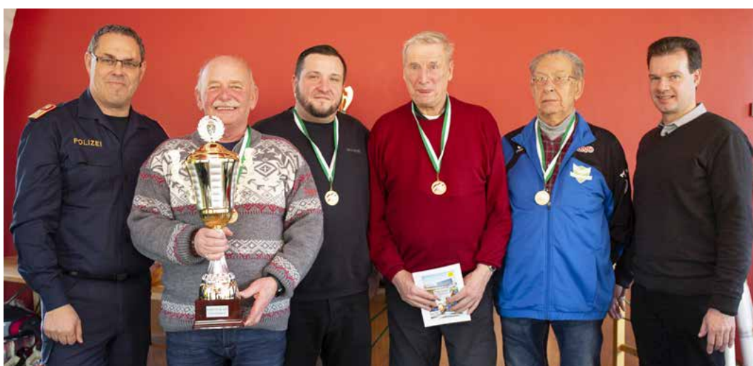
Die Mannschaft VÖB Eccher/Pol.-SV Graz Oldies erreichte den 1. Platz in der Gruppe B

FEICHTINGER Schmuckhandel und -Manufaktur