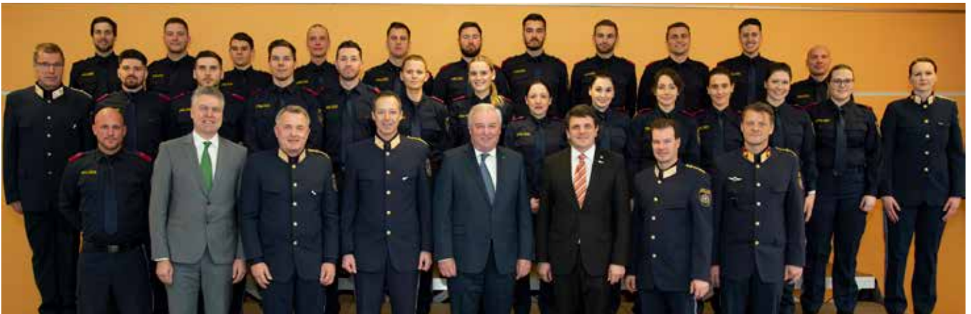
Der GAL G-PGA 13-18-D-St