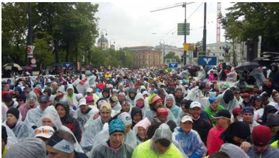
Läufer für den guten Zweck

Es handelt sich um einen Benefizlauf zu Gunsten der Knochenmarkforschung. Die TeilnehmerInnen der PSV-Graz schlossen sich hier dem Team „BMI-Sport“ an und waren somit ein kleiner Teil des BMI-Teams mit 705 Members. Durch das Team wurden insgesamt etwas mehr als € 32.000.- gesammelt und gespendet. An den Start gingen in der Folge 459 Teammitglieder. Diese liefen insgesamt ca. 6.820 km für den guten Zweck.