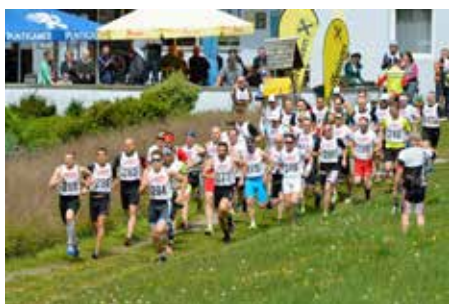
Der sportliche Wettkampf beginnt

So idyllisch präsentierte sich der Hausberg von Mühlen, der Zirbitzkogel, am Wettkampftag. Die Schneereste waren ein eindeutiges Zeichen, dass die letzten Wochen einfach zu kalt gewesen waren. Der Badeteich hatte gerade einmal 11 Grad Wassertemperatur. Die Veranstalter mussten daher anstelle des traditionellen Triathlons zum ersten Mal einen Duathlon veranstalten. Es waren zwei Runden um den Teich (3,6 km) zu laufen, danach in bewährter Manier die Radstrecke Richtung Hüttenberg und retour (21 km) und im Anschluss wieder eine Laufrunde (1,8 km) zu absolvieren.