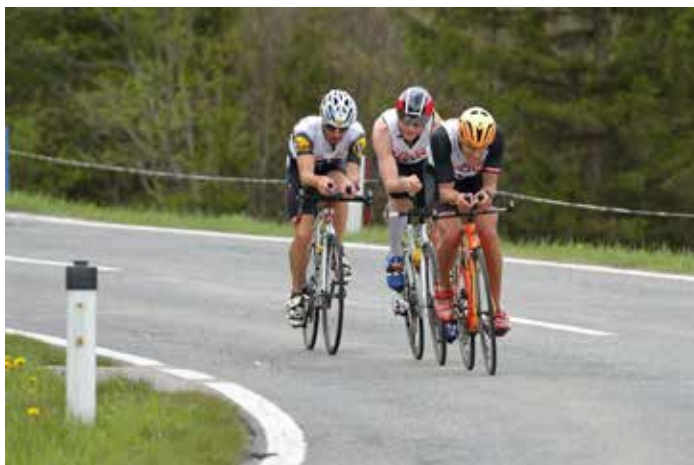
Kampf um den Tagessieg