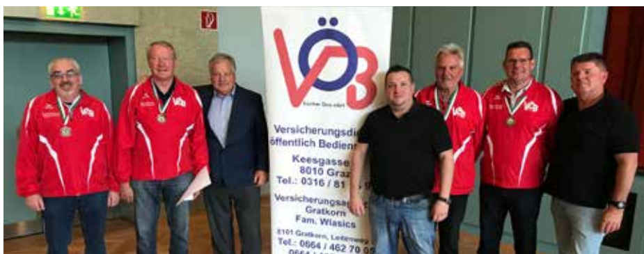
Sieger der Gruppe A und Landesmeister 2019 - Gendarmerie-Polizei Pensionisten