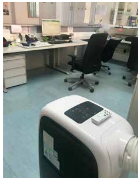
Das neue Klimagerät im Einsatz