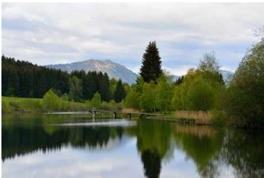
Mühlener Teich am Morgen des Wettkampftages