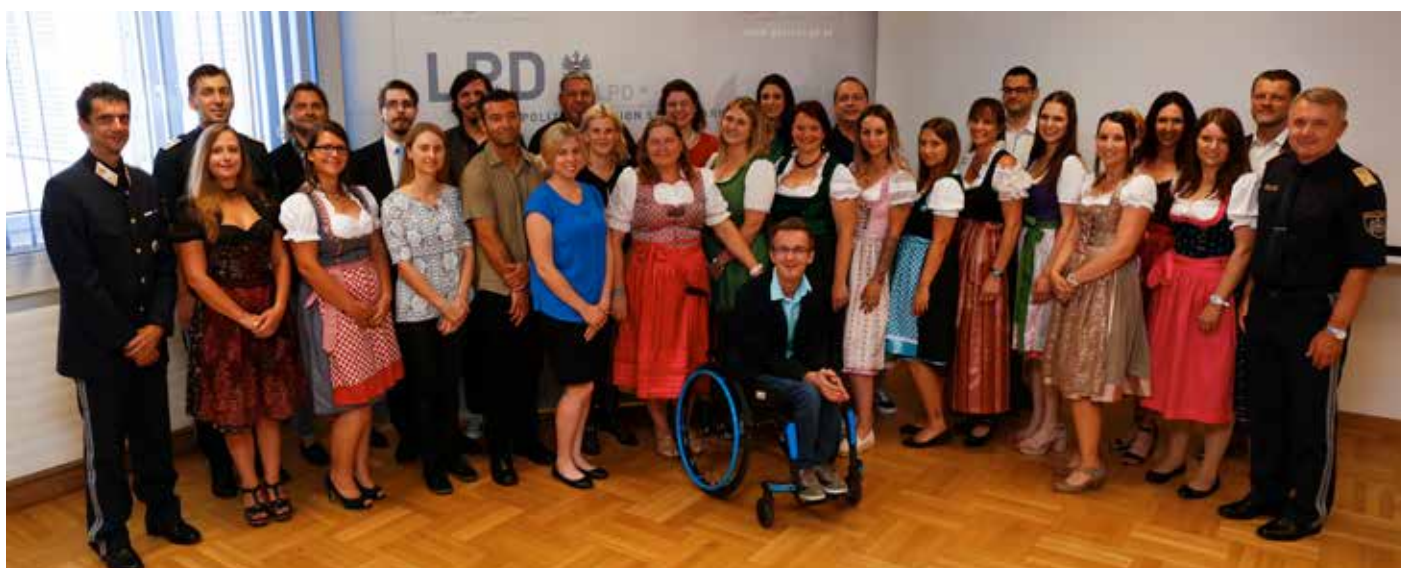
Teilnehmerinnen und Teilnehmer des A3/V3-Verwaltungslehrganges