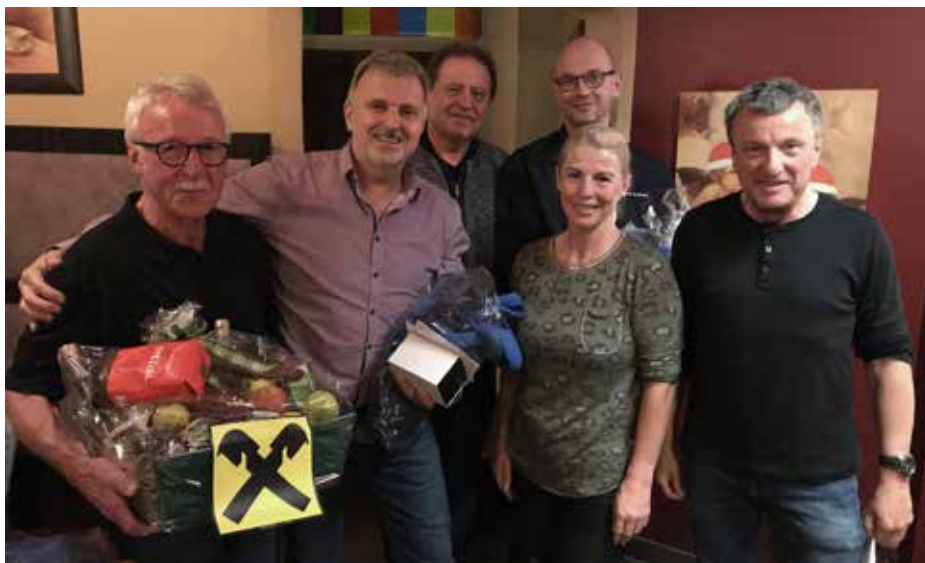
Die Sieger beim FSG- Schnapsen HF