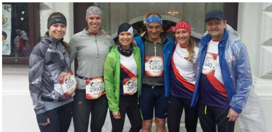
Das Team der PSV-Graz

fahrende Ziellinie ihre Geschwindigkeit um 1 km/h bis die letzten Läufer eingeholt worden war. Die erreichte Distanz der Läufer/innen wurde in die Ergebnisliste eingetragen.