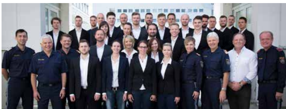
Der GAL G-PGA09-19-C-St