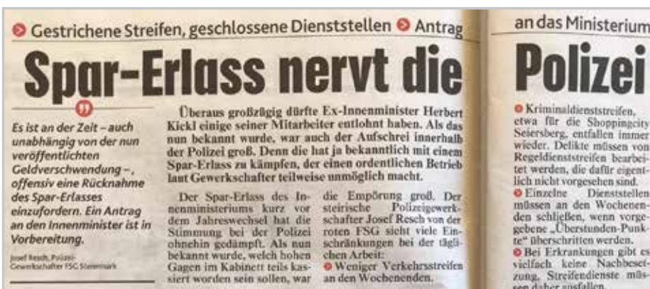
Faksimile Kronen Zeitung v. 25.06.2019