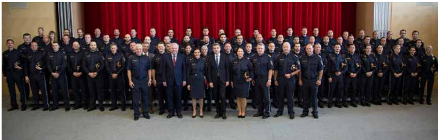
Die Absolventinnen und Absolventen des GAL E2a mit den Ehren- und Festgästen

Und so hatten sich die Absolventinnen und Absolventen diesen sehr würdigen und feierlichen Rahmen auch redlich verdient. Nicht zuletzt ermöglicht durch die tatkräftige Unterstützung der Marktgemeinde Seiersberg, die nicht nur die klimatisierte Festhalle, sondern auch ein reichhaltiges Buffet zur Verfügung gestellt hatte.