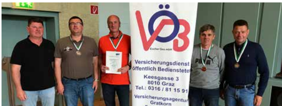
Sieger der Gruppe B und somit Aufstieg in die Gruppe A für das Team Bezirk Südost