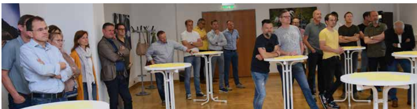
Gäste bei der Ehrung