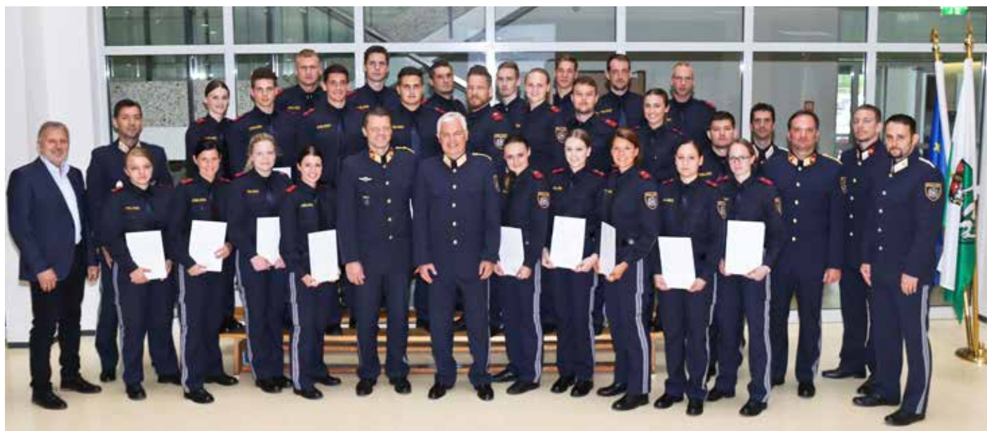
Die Kolleginnen und Kollegen des Grundausbildungslehrganges FGB05-18-St mit Ehrengästen