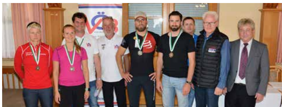
Die Klassensieger Steiermark