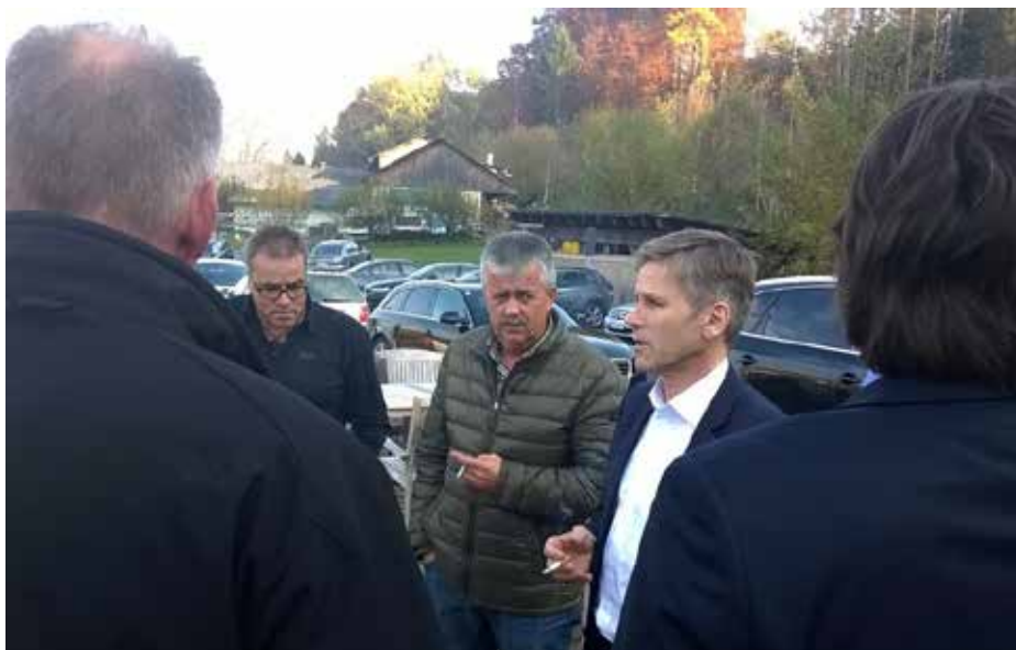
Im Gespräch mit Kollegen

Daher war auch die klare Botschaft der Funktionäre an die anwesenden Vertreter der Politik, so rasch als möglich jene Rahmenbedingungen zu schaffen, die es der Polizei wieder ermöglichen, zu gewohnt professioneller und gesetzmäßiger Arbeit zurückzukehren.