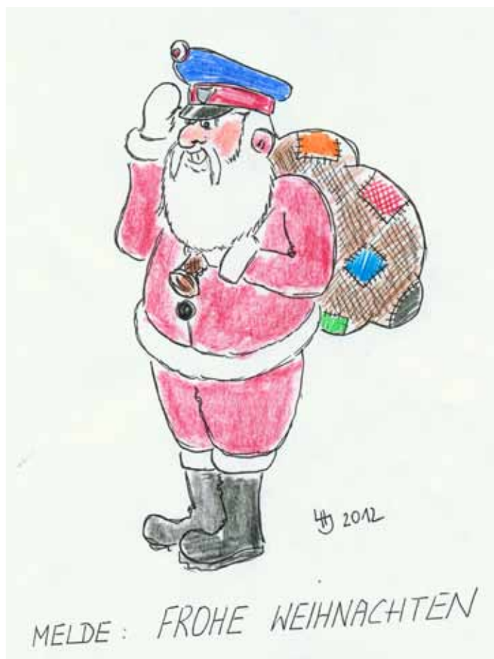
Melde: Frohe Weihnachten