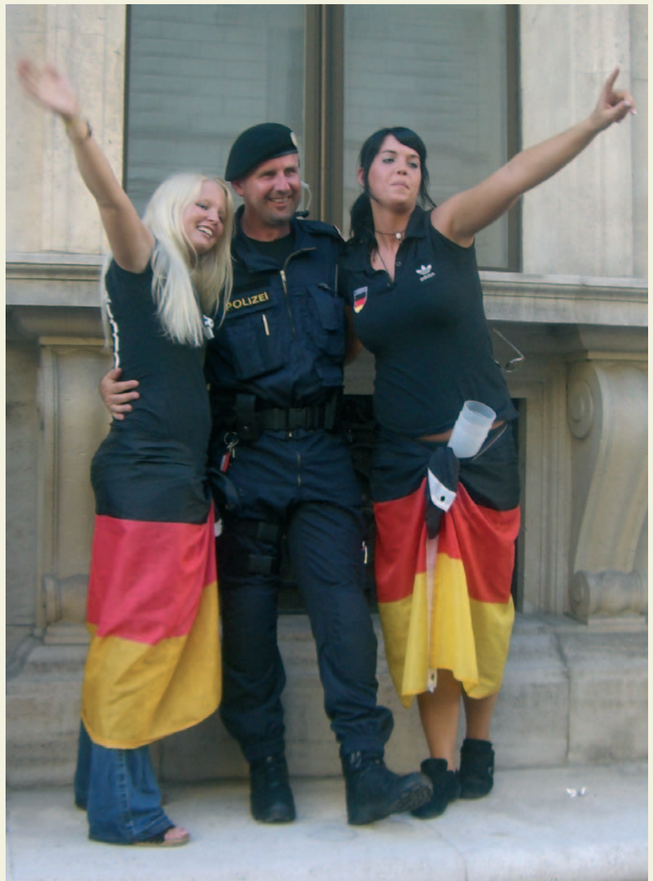
Beliebtes Fotomotiv – Die österreichische Polizei