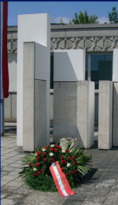
Zum Gedenken an unsere verstorbenen Kollegen

Die Festveranstaltung zum Tag der Bundespolizei fand am 4.7.2008 im Beisein der Abg. zum Steirischen Landtag – Werner BREITHUBER und Eduard HAMEDL – im Ehrenhof des Landespolizeikommandos für Steiermark statt. Nach den Begrüßungsworten der Ehrengäste und der Festansprache durch den Landespolizeikommandanten