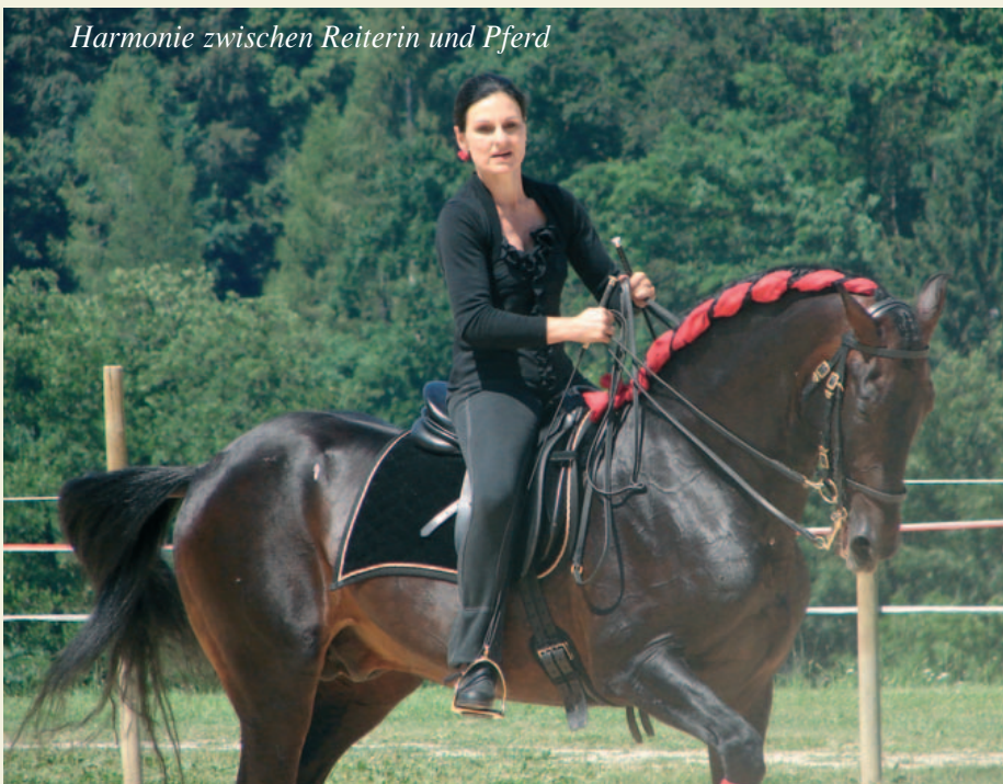
Harmonie zwischen Reiterin und Pferd

Der Abend klang musikalisch aus und fand mit einem Frühschoppen mit der Markt- und Musikkapelle Hl. Kreuz/Waasen seine Fortsetzung. Im Rahmen einer amerikanischen Versteigerung wurde ein Wochenende mit einem Porsche ver-