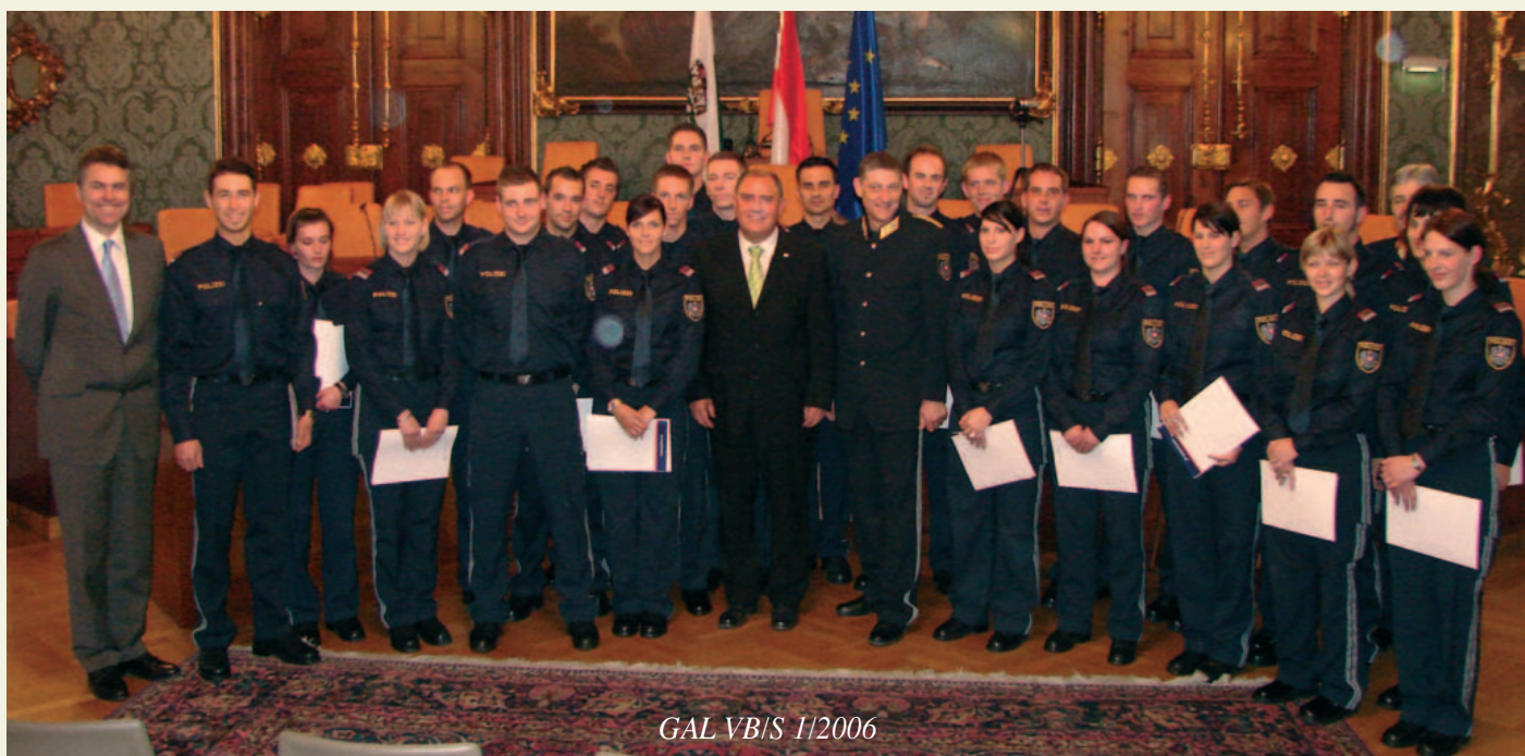
GAL VB/S 1/2006