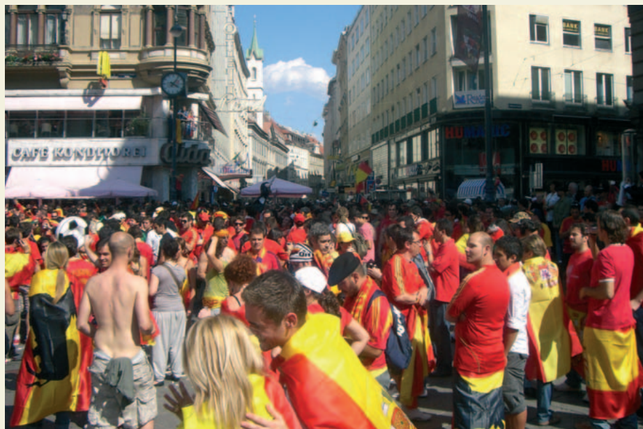
Die EURO2008 bewegte Massen

Trotz dieses jetzt sehr positiven Gesamtbildes, das nicht getrübt werden sollte, darf man nicht ohne über all das Nachzudenken, zum Alltag der polizeilichen Arbeit übergehen. Denn sonst würden ja einige behaupten, wir tun jetzt so, als ob sowieso ‚alles super‘ gewesen wäre und es von Anfang an klar war, dass es gar nicht anders hätte kommen können.