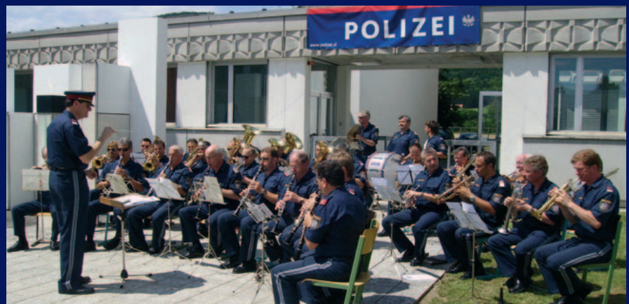
Die Polizeimusik Steiermark

Die Ehreninformation wurde durch 2 Klassen des BZS Steiermark gestellt. Für die musikalische Umrahmung sorgte schwungvoll die Polizeimusik Steiermark.