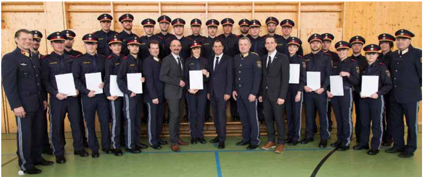
Grundausbildungslehrgang St-PGA05/16-D-ST mit Ehrengästen