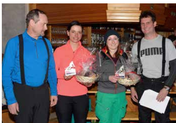
Bezirksskimeisterin 2018 – Bezirk Murtal