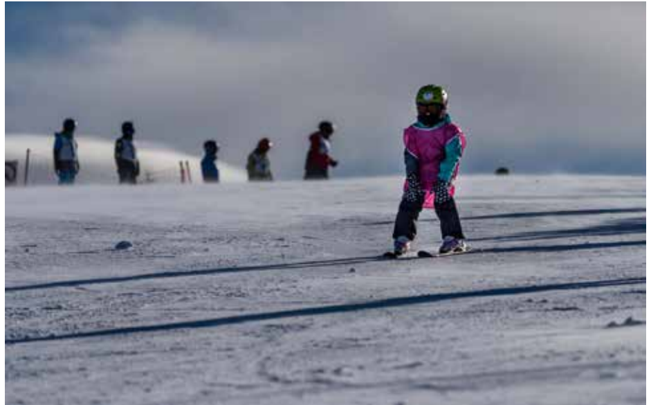
Kalter Wind, aber tolle Pistenbedingungen

Nach krankheitsbedingten Absagen konnten dann von unseren SkilehrerInnen 38 Teilnehmer (darunter 12 Anfänger, ►