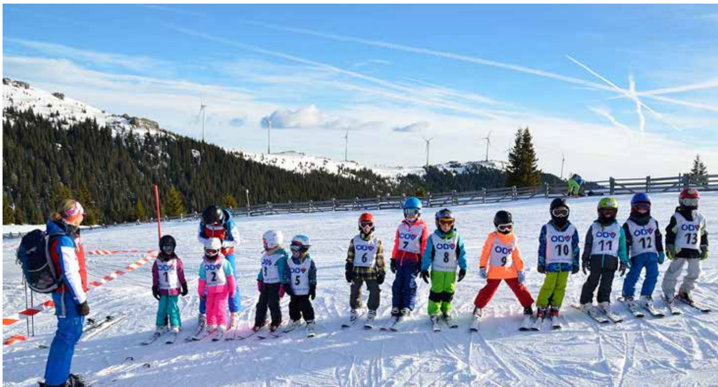
Aufregung vor dem großen Rennen

► 21 Fortgeschrittene) und unsere jugendlichen Snowboarder im Alter von 3 bis 13 Jahren begrüßt werden, die täglich von der LPD mit dem Bus auf die Weinebene verbracht wurden.