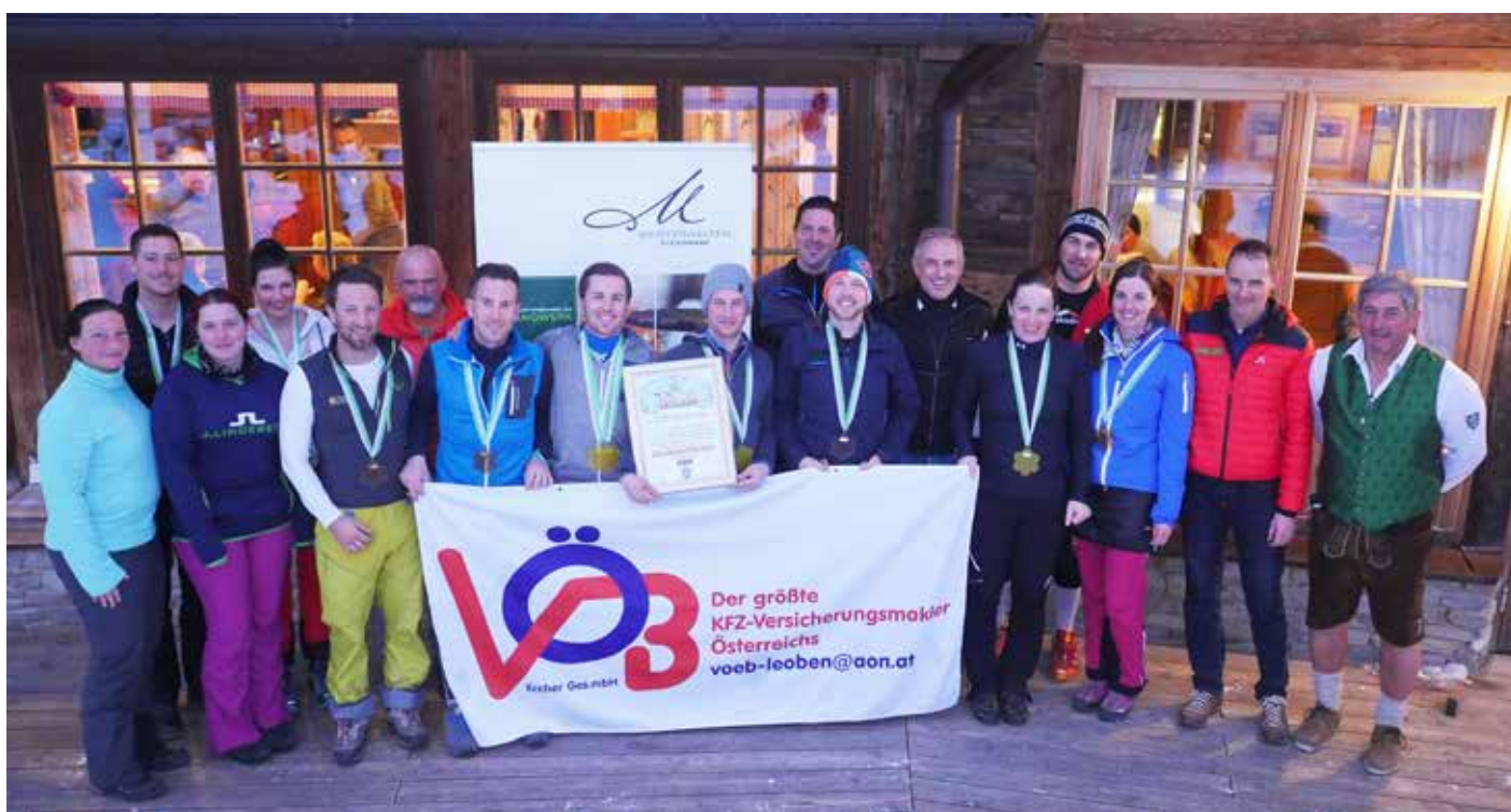
Die Sieger vor der Latschnhütte