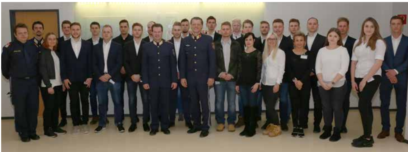
Der GAL St-PGA04-18-F-St