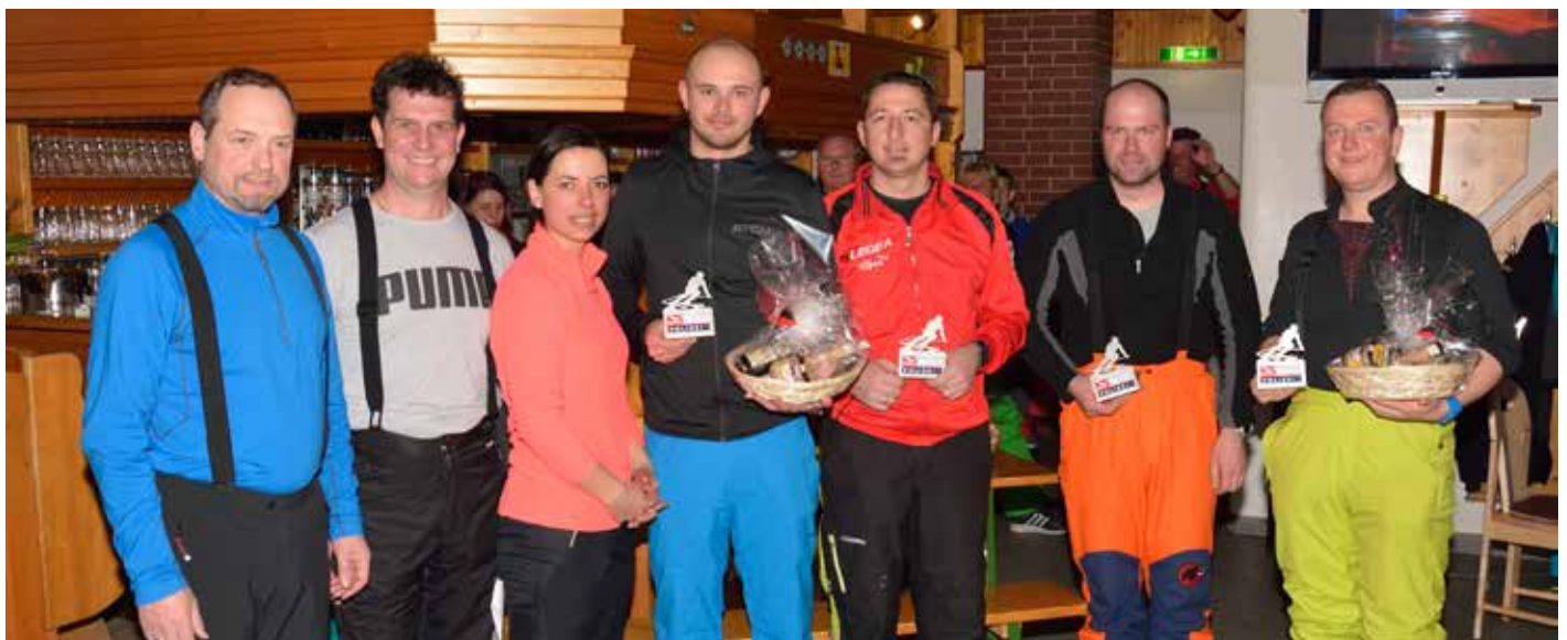
Bezirksskimeister 2018 – Bezirk Murau