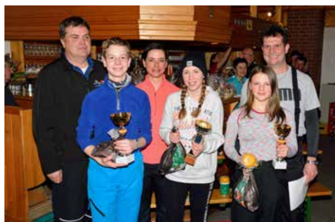
Siegerehrung in der Kinderklasse