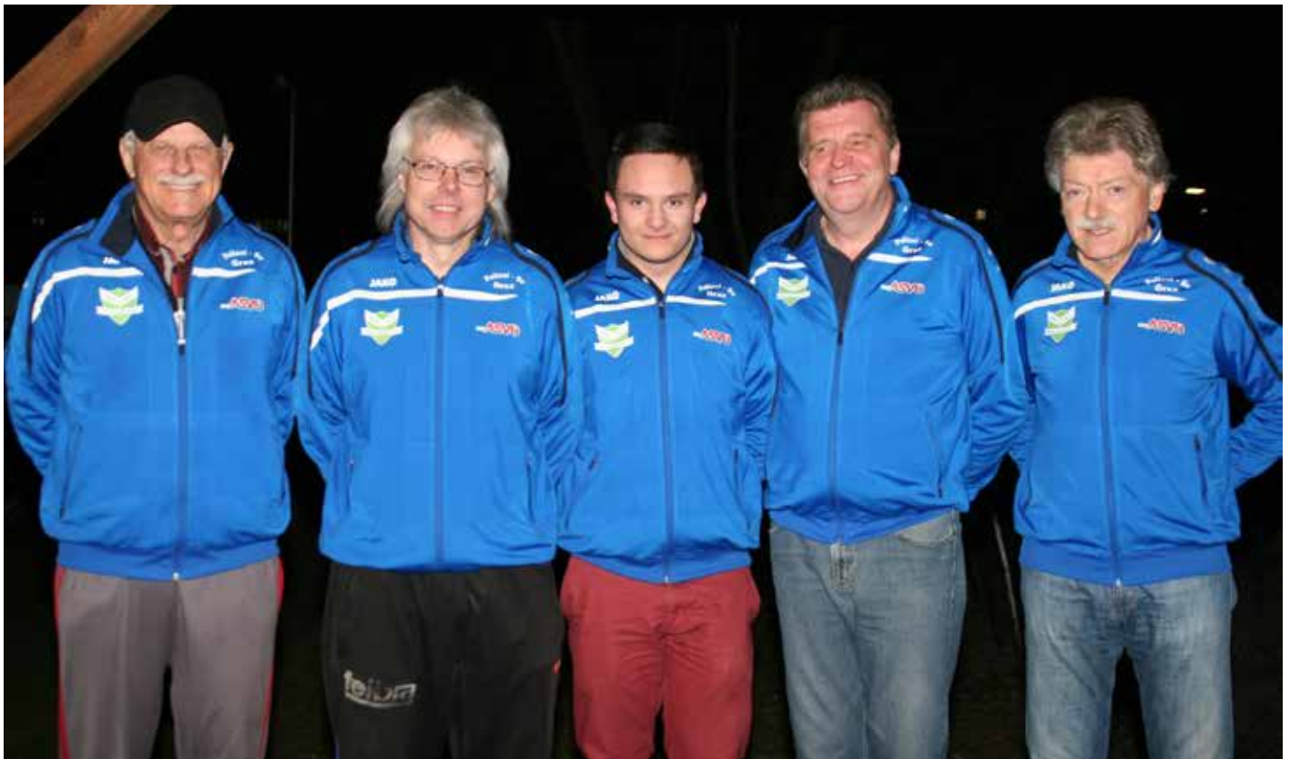
Das Team der SSG Polizei Afritschgarten Graz kämpft im Finale um den Pokalsieg