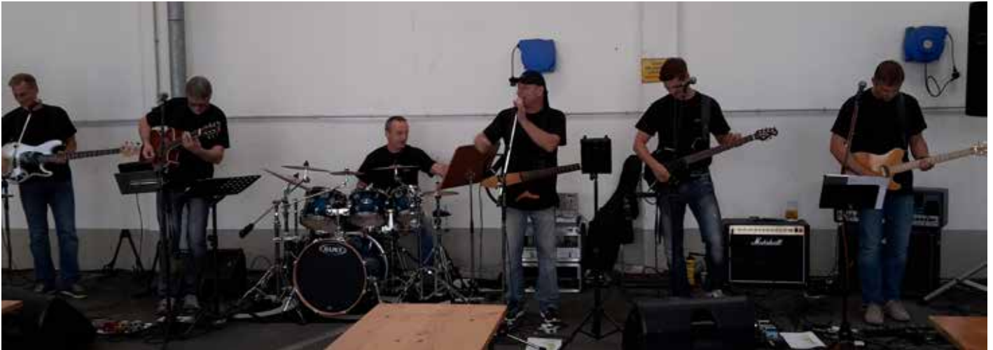
Man in Black-Cobra-Combo

Am 21.08.2015 fand in der Polizeikaserne Karlauer Straße 14 das Sommerfest des EKO-Cobra/DSE Süd statt. Auf dem Programm stand ab 10:00 Uhr ein Fußball-Blitzturnier (Ergebnis siehe unten).