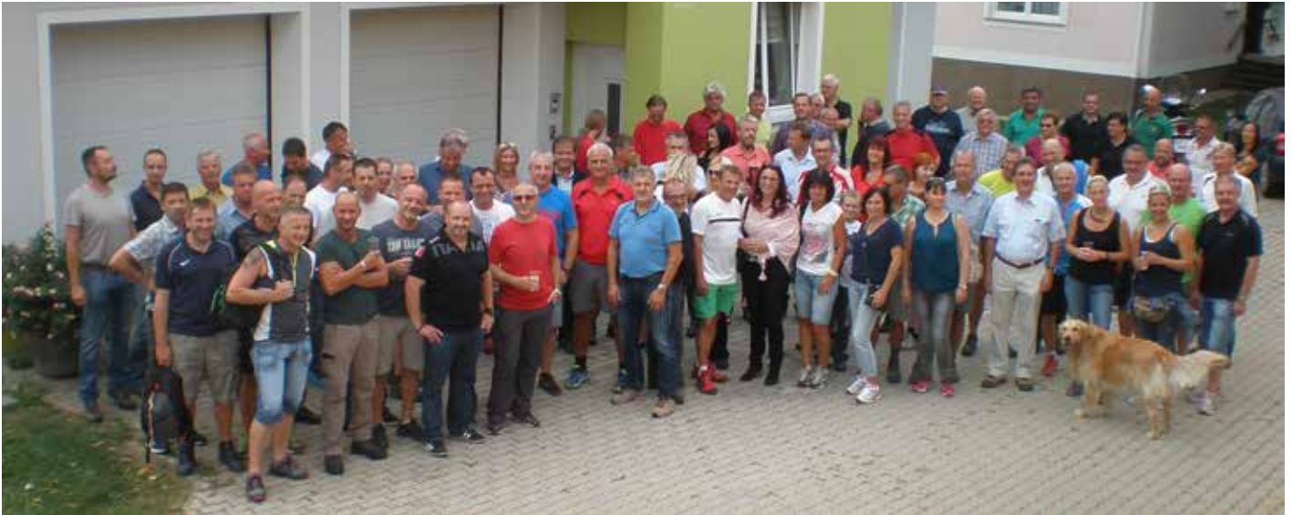
Start beim GH MAIERHOFER

Auch in diesem Jahr lud der „Klub der Exekutive Hartberg-Fürstenfeld“ die verschiedenen Behörden und Institutionen des Bezirkes Hartberg-Fürstenfeld zur traditionellen Hartberg-Wanderung.