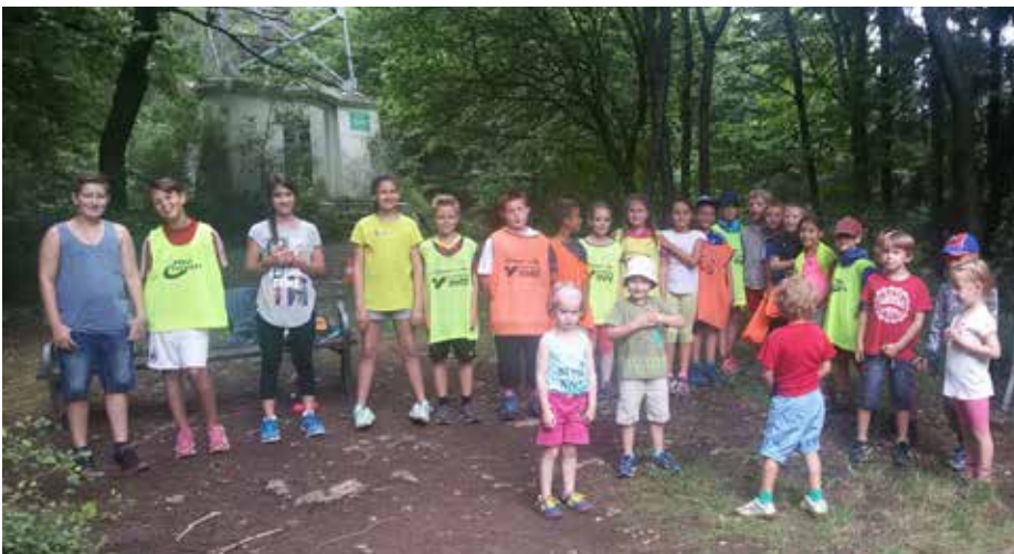
Die Kinder am Ziel

Ein recht herzliches Dankeschön an dieser Stelle für die Unterstützung der Kolleginnen und Kollegen natürlich auch an MIKL Josef und seiner Frau Ilse, für tolle Unterstützung vor Ort und die Verköstigung an allen 4 Tagen. Ohne diese Unterstützung wären die Kindersporttage nicht umsetzbar. Ebenfalls ein Dankeschön an unseren Dienstgeber, für die Möglichkeit der Ausübung der Kindersporttage im Dienst sowie der Freistellung der beteiligten KollegInnen.