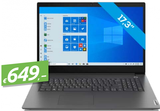
LENOVO V17-IIL IRON GREY (82GX008EGE) 17.3" NOTEBOOK, I3-1005G1, 8GB/256GB SSD, WIN10PRO