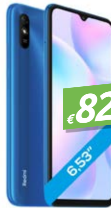
XIAOMI REDMI 9AT 32GB SKY BLUE DISPLAY: 6.53", 32GB, 2GB RAM