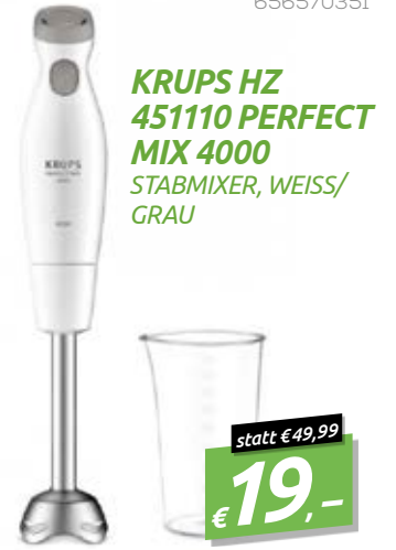
KRUPS HZ 451110 PERFECT MIX 4000 STABMIXER, WEISS/ GRAU