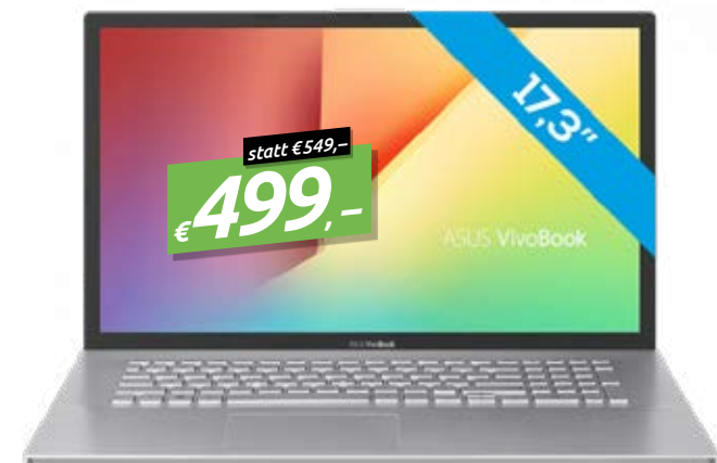
ASUS VIVOBOK S17 S732DA-BX578T SILBER 17.3" NOTEBOOK, 8GB/256GB, WIN 10 HOME