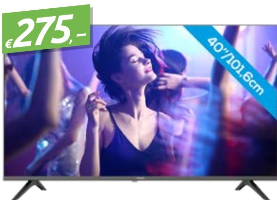
HISENSE 40A5600F 40", FULL-HD FEATURETV