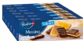
BAHLSSEN MESSINO VOLLMILCH 6x125G SOFTGEBÄCK (ORANGENFÜLLUNG & VOLLMILCH SCHOKOLADE)