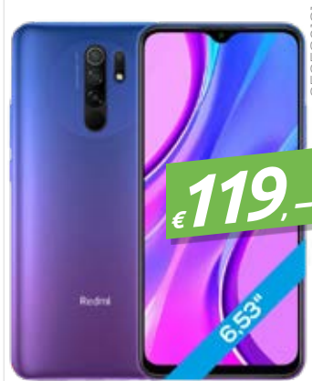
XIAOMI REDMI 9 32GB SUNSET PURPLE DISPLAY: 6.53", 32GB, 3GB RAM