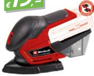
EINHELL TE-OS 18/1 LI SOLO AKKU-MULTISCHLEIFER