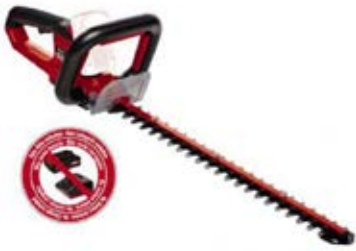
EINHELL ARCURRA SOLO AKKU-HECKENSCHERE