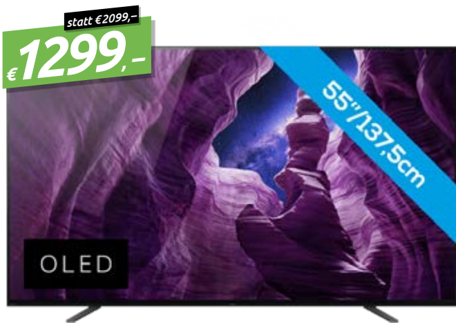
SONY KD-55A8 FLAT-TV OLED, 55", 4K UHD, HDR