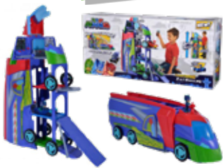
SIMBA TOYS PJ MASKS VERWANDELBARES HAUPTQUARTIER SPIELSET