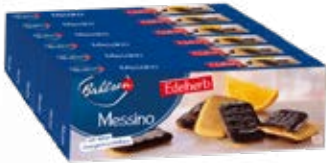
BAHLSSEN MESSINO EDELHERB 6x125G SOFTGEBÄCK (ORANGENFÜLLUNG & EDELHERB SCHOKOLADE)