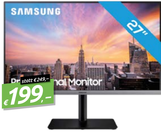
SAMSUNG S27R650, 27" LCD DIAGONALE: 27"/68.6CM, AUFLÖSUNG: 1920x1080