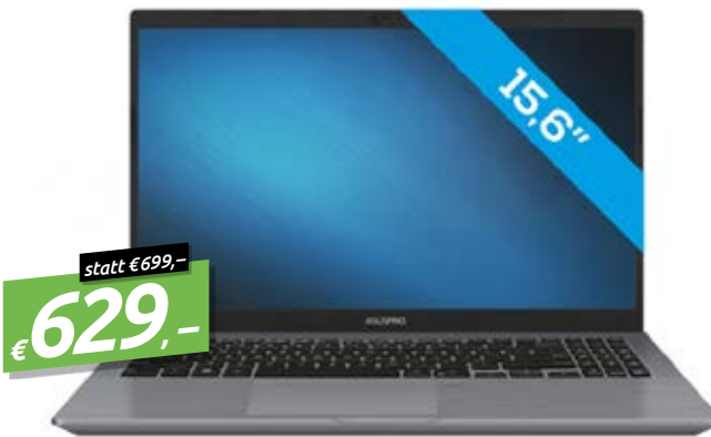
ASUS EXPERTBOOK P3540FA-BQ1150R STAR GREY 15.6" NOTEBOOK, 8GB/256GB, WIN 10 PRO