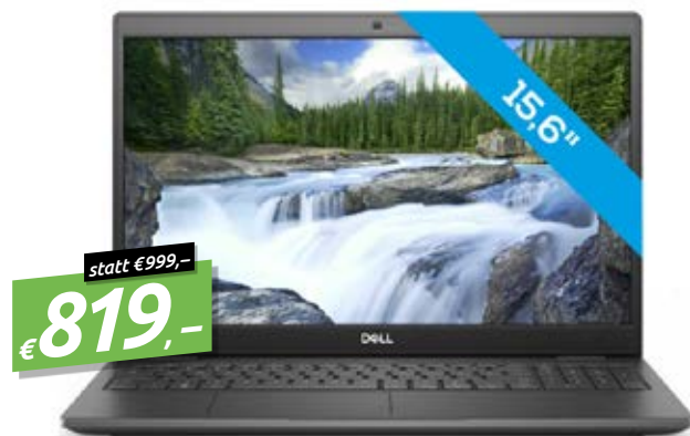
DELL LATITUDE 3510, I7-10510U 15,6" W10P, FULL HD, 8GB RAM, 256GB SSD