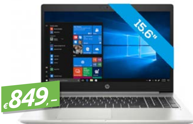
HP PROBOOK 450 G7 (9TV24ES#ABD) 15.6", I5-10210U, 8GB RAM, 512GB SSD, W10P64