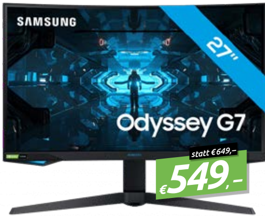
SAMSUNG ODYSSEY G7 C27G75TQSU 27" LCD MONITOR, 27", WQHD, 16:9, 2560x1440