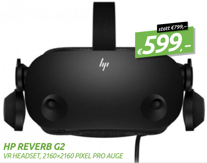
HP REVERB G2 VR HEADSET, 2160x2160 PIXEL PRO AUGE