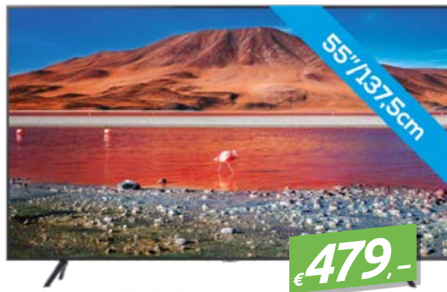
SAMSUNG 55TU7170 55" LED 4K SMART-TV