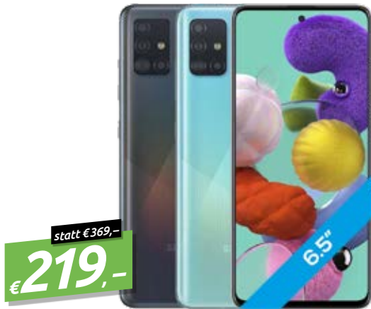
SAMSUNG GALAXY A515F 6.5" SMARTPHONE, 128GB, 4GB RAM