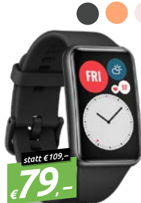
HUAWEI WATCH FIT 1.64" SMARTWATCH, BLUE- TOOTH, GPS