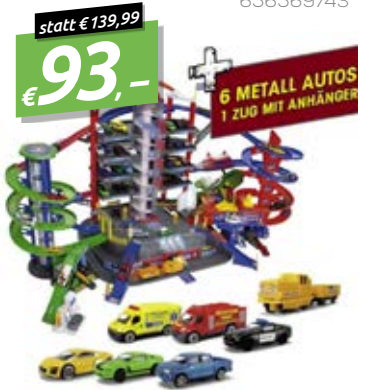
MAJORETTE SUPER CITY GARAGE KINDERSPIELZEUG